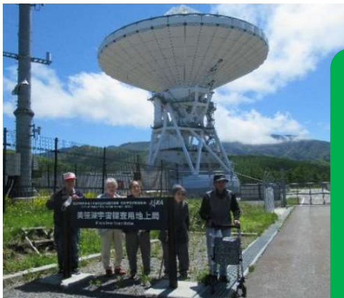
美笹湖の パラボラアンテナ